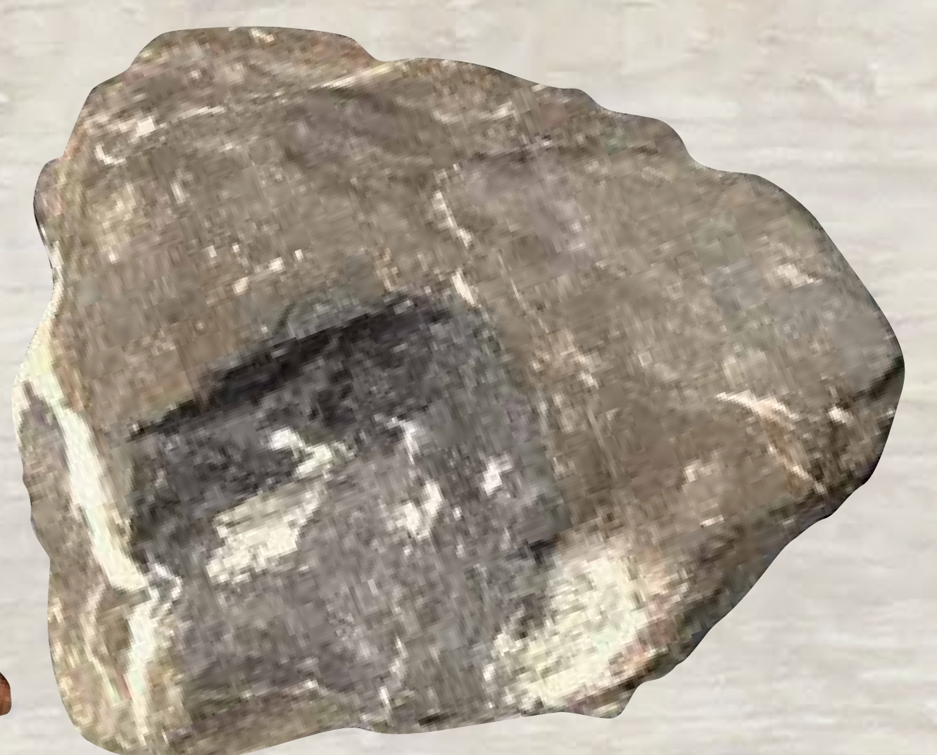
Steinn úr barlest