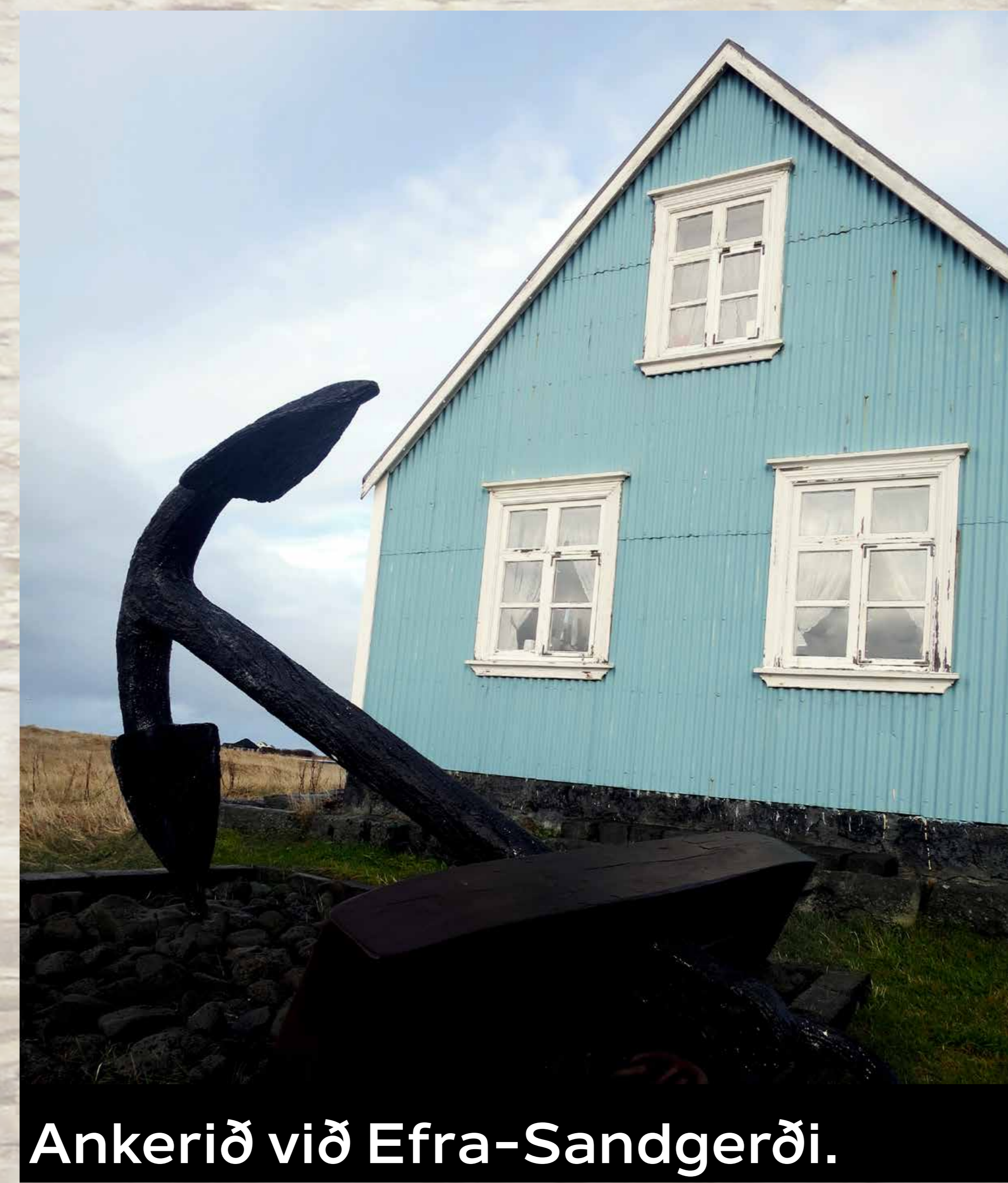
Ankerið við Efra-Sandgerði.

þeirri ferð fundu þeir ankerið og keðjulásinn á hafsbotni. Samkvæmt landslögum þarf að tilkynna allt sem finnst og er yfir 100 ára gamalt til Minjastofnunar ríkisins. Þeir félagar tilkynntu fundinn og fengu í kjölfarið einkaleyfi til að rannsaka staðinn.